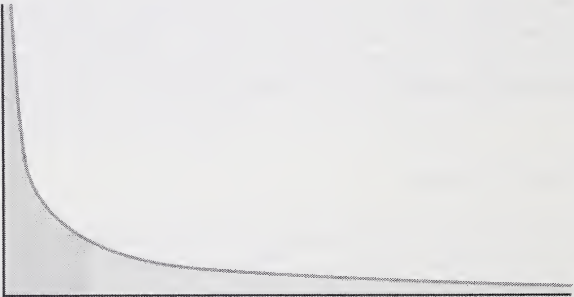
Iperbole Long Tail

Esempio di un grafico della legge di potenza che mostra una classifica di popolarità. A destra, in grigio chiaro, si trova la long tail . A sinistra, in grigio scuro, i prodotti che dominano il mercato. Le due aree misurano la stessa superficie. L'andamento della curva è tipicamente iperbolico.